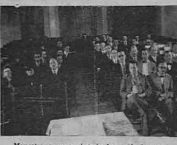
Momentos en que se efectuaba la reunión de inspectores en la Escuela Vialto Madrugal.

Los jefes de Enseñanza excitaban al magisterio nacional para que colabore en la elevada tarea de la enseñanza