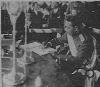
LA TOMA DE POSESION DEL GENERAL MARTINEZ

"DIARIO DE COSTA RICA" ofrece hoy la interesante información crítica del acto de toma de posesión del general Max. H. Martínez en El Salvador. De izquierda a derecha: El general Menéndez, presidente provisional de la república, en el momento de entregar el cargo al general Martínez, momento después de ser investido con el mando presidencial firmando el trascendental documento constitucional. Fotos especiales para "DIARIO DE COSTA RICA".